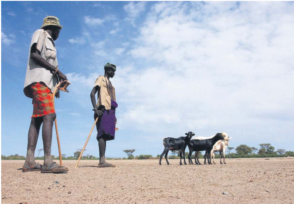
Locals van de Turkanastam op weg met hun geiten. Ze gaan deze verkopen aan inwoners van Kakuma.

Maar de echte stad is tegenwoordig natuurlijk niet het plaatsje Kakuma, maar het even verderop gelegen kamp. Vanuit Kakuma Town is het een kort ritje naar het kamp. We hoeven alleen de droge rivier, bevoeld door Turkanaherders met hun beesten, over te steken. Bij binnenkomst