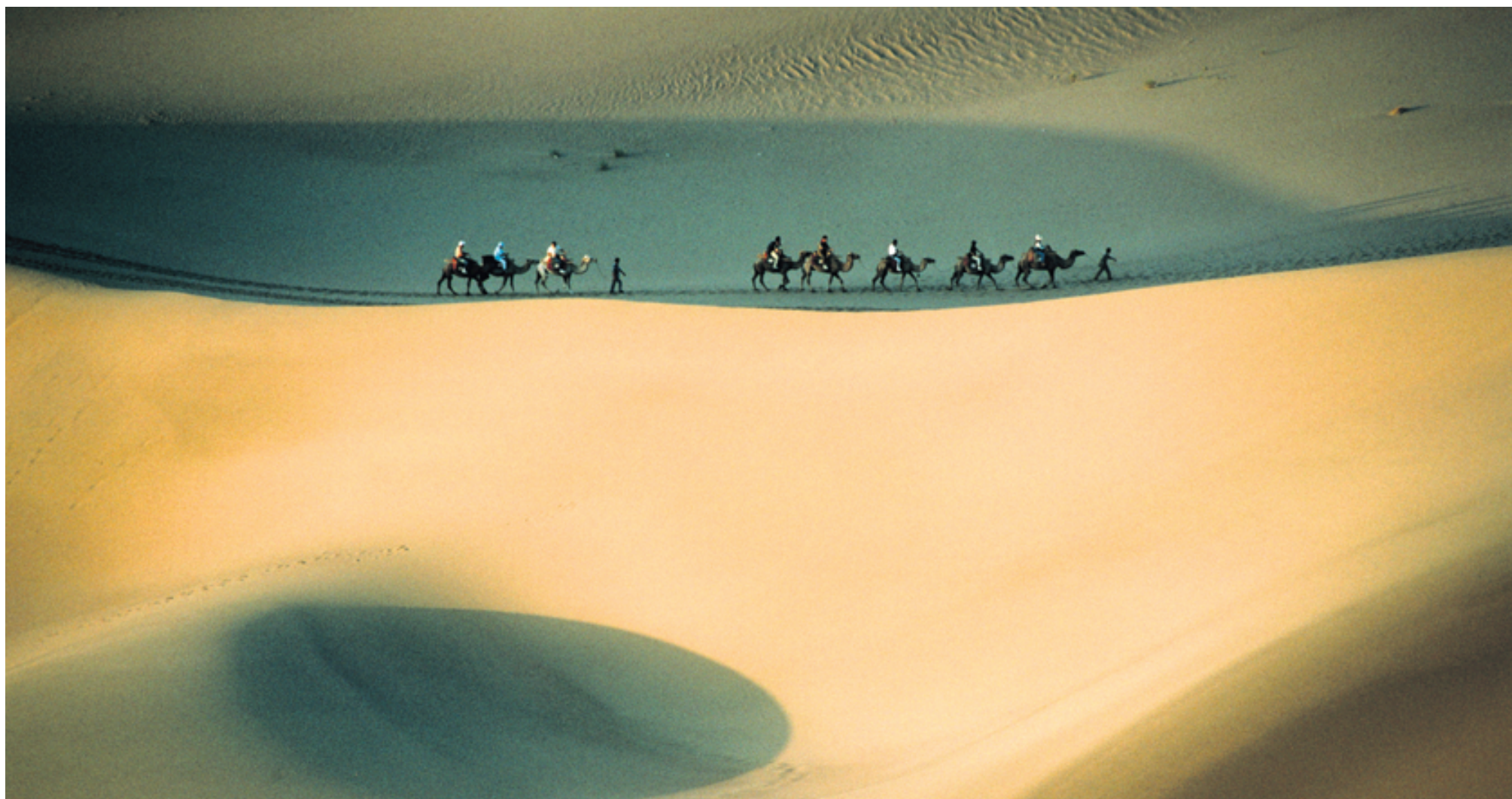
Een karavaan trekt over de Zijderoute in westelijk China. De Zijderoute is een eeuwenoud netwerk van handelswegen dat Oost en West met elkaar verbond.